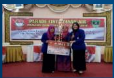
Juara 1 PCTA Tingkat Perguruan Tinggi