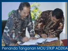
Penanda Tangan MOU STKIP ADZKIA dengan Universitas Pakuan Bogor