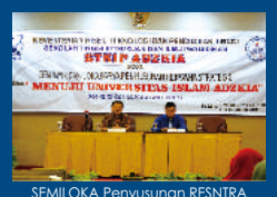
SEMILOKA Penyusunan RESNITRA