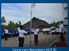
Upacara Bendera HUT RI